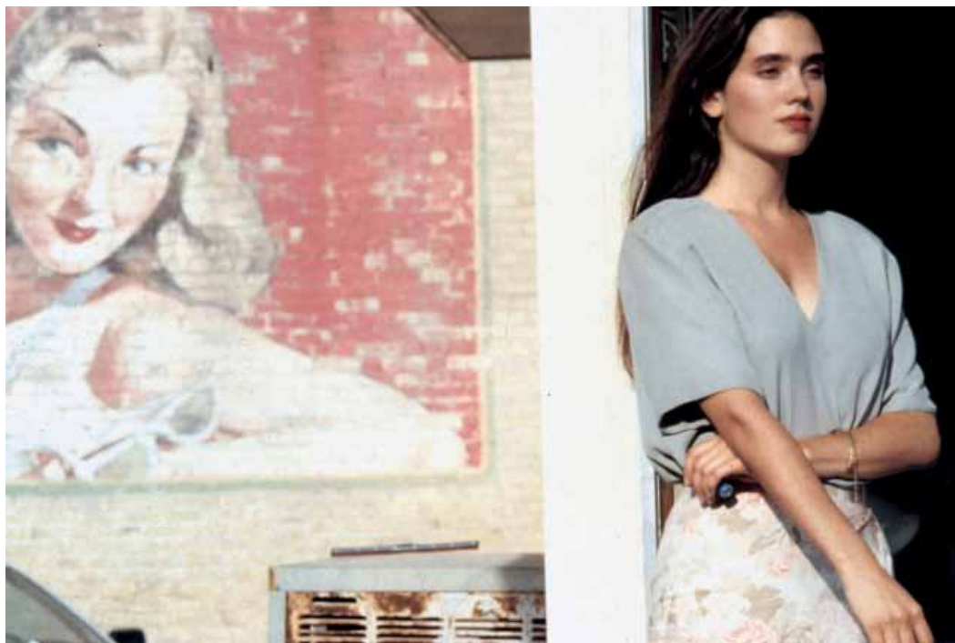
Jennifer Connelly dans The Hot Spot de Dennis Hopper (1990)