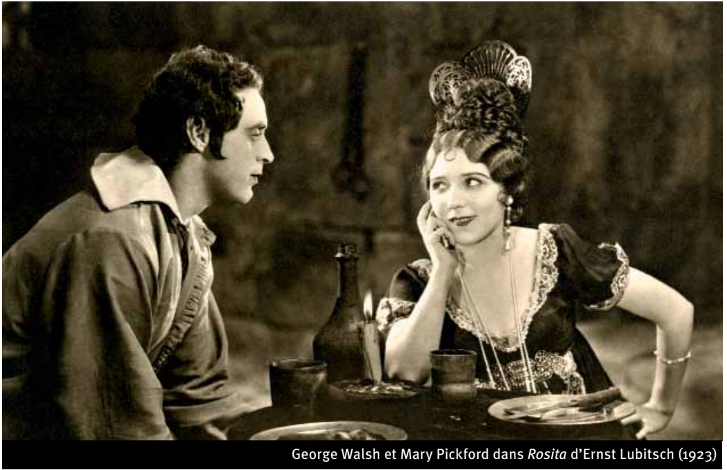
George Walsh et Mary Pickford dans Rosita d'Ernst Lubitsch (1923)