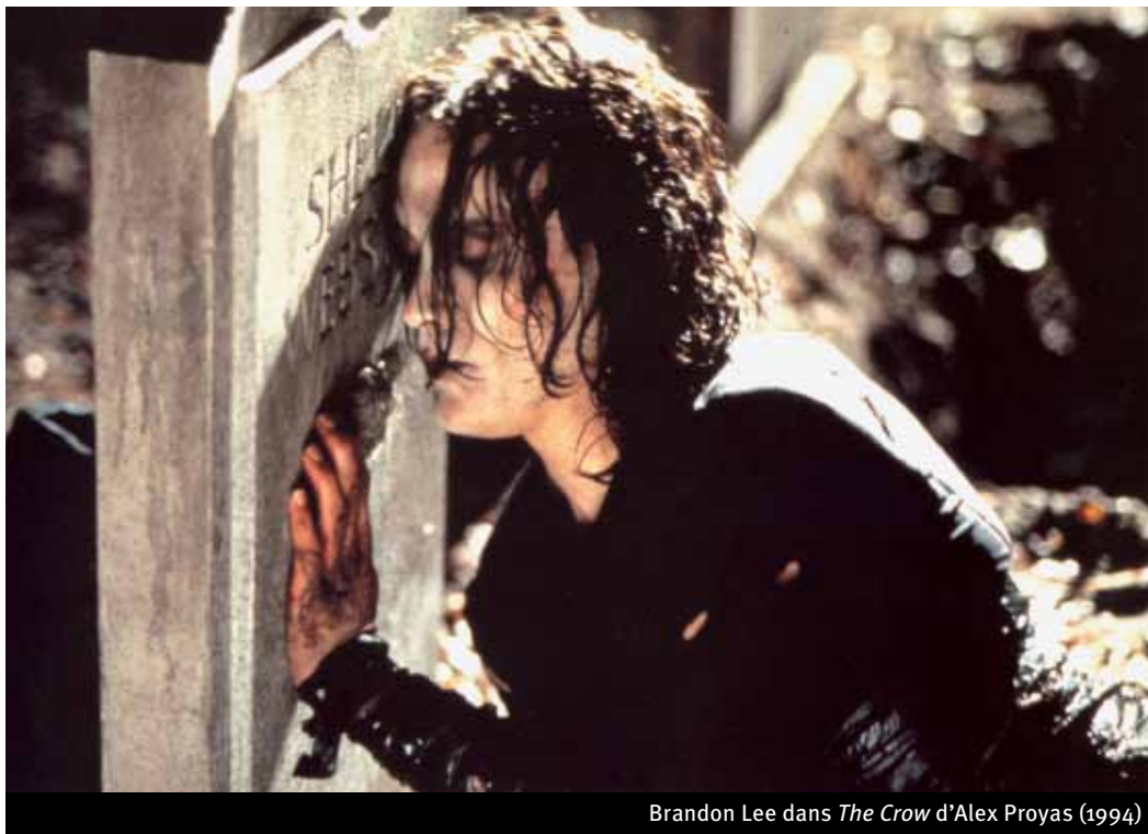
Brandon Lee dans The Crow d'Alex Proyas (1994)