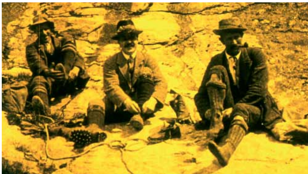
Switzerland off the Beaten Track