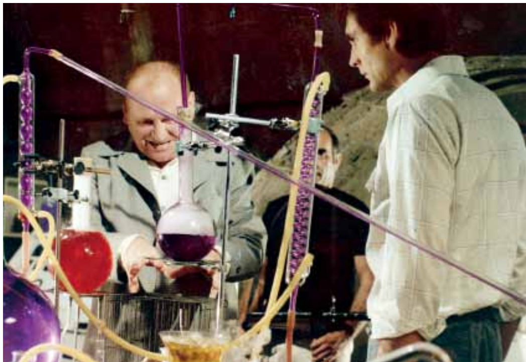
Gert Fröbe et John Phillip Law dans Docteur Justice de Christian-Jaque (1975)