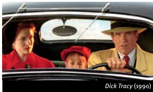
Dick Tracy (1990)