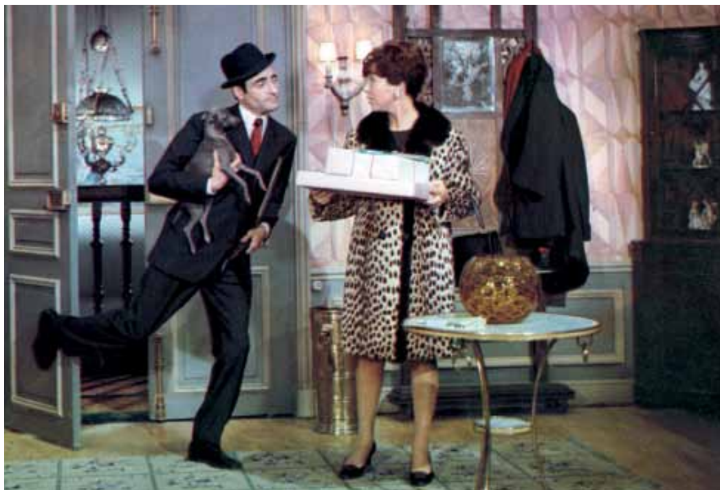
Pierre Etaix et Annie Fratellini dans Le Grand amour (1968)

Spectacle Miousik Papillon au Théâtre Vidy-Lausanne du 2 au 7 novembre. Intégrale Pierre Etaix, à partir du 8 novembre à la Cinémathèque suisse (informations détaillées dans le prochain bulletin et sur www.cinema.theque.ch ).