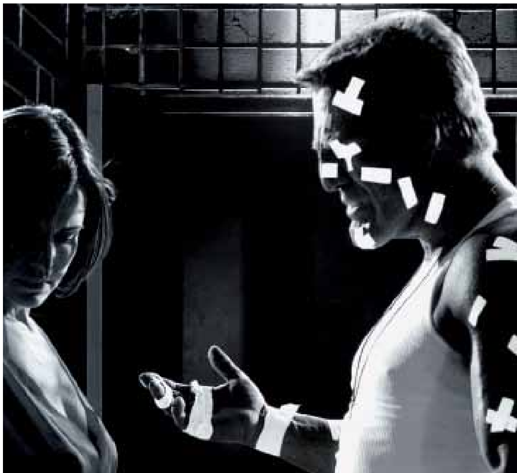
Carla Gugino et Mickey Rourke dans Sin City de Frank Miller et Robert Rodriguez (2005)