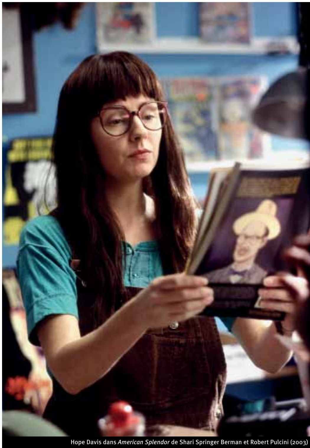
Hope Davis dans American Splendor de Shari Springer Berman et Robert Pulcini (2003)