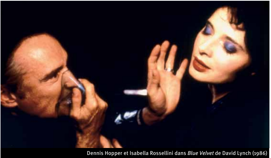
Dennis Hopper et Isabella Rossellini dans Blue Velvet de David Lynch (1986)