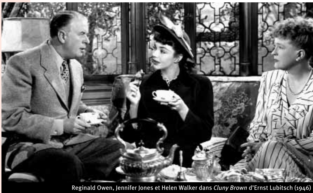
Reginald Owen, Jennifer Jones et Helen Walker dans Cluny Brown d'Ernst Lubitsch (1946)