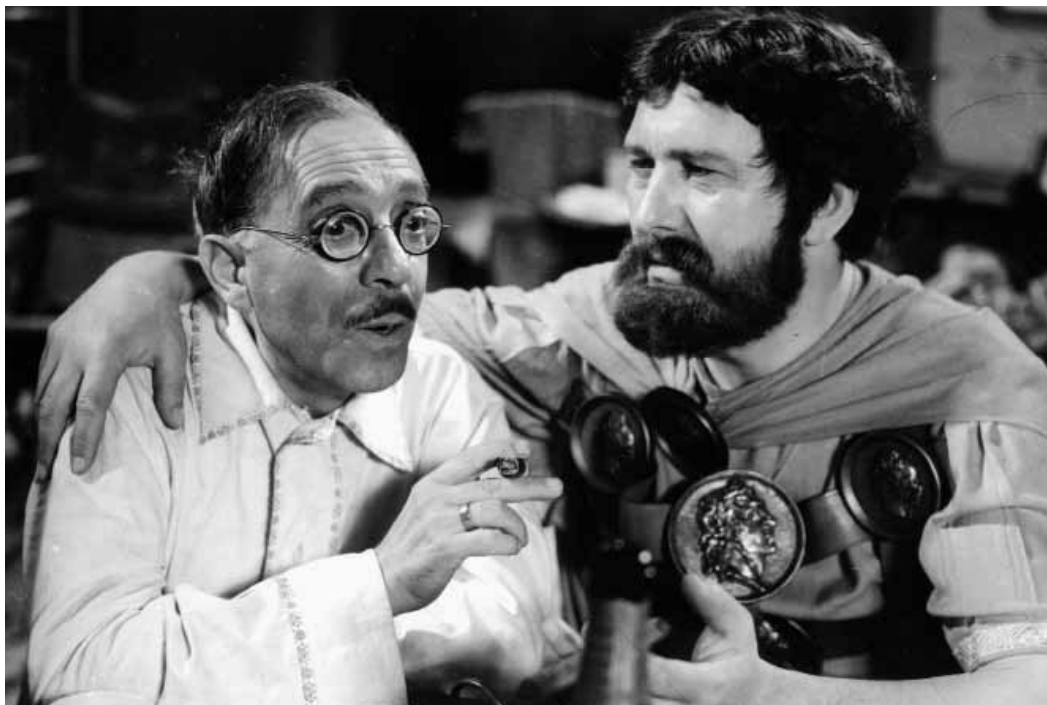
Ernö Szabó et Ferenc Bessenyei dans Professeur Hannibal de Zoltán Fábri (1956)