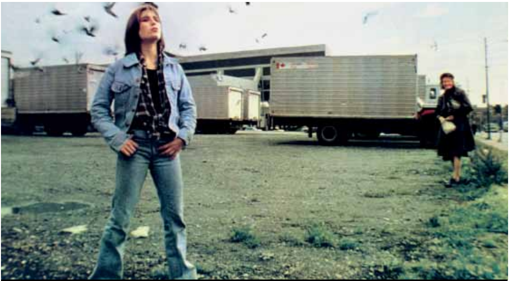
Linda Manz dans Out of the Blue de Dennis Hopper (1980)