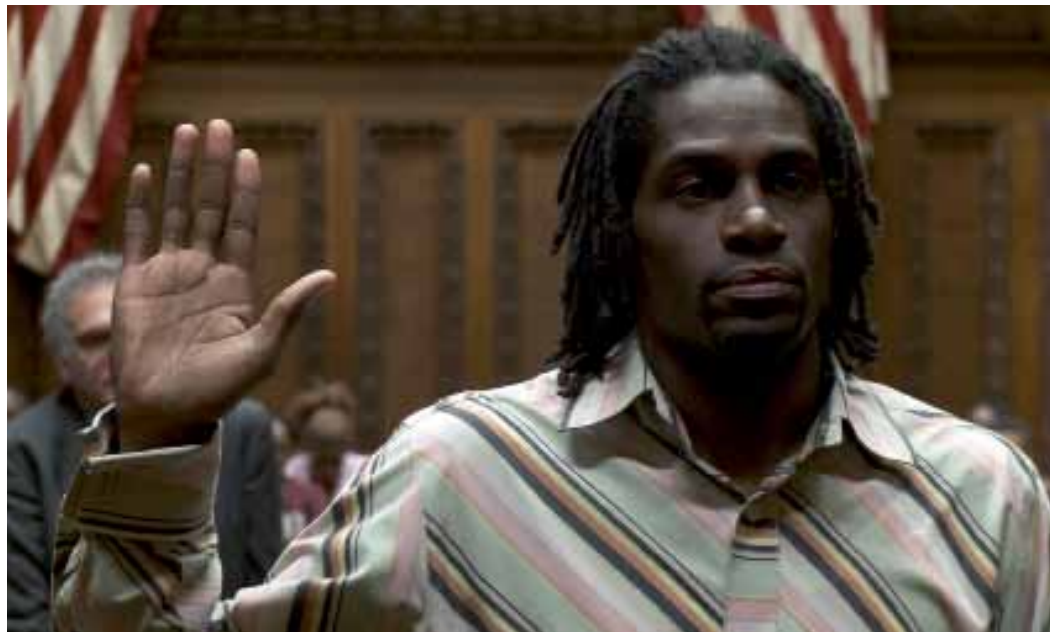
Cleveland contre Wall Street de Jean-Stéphane Bron (2010)