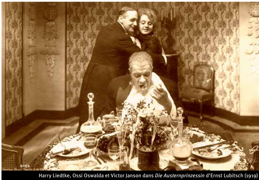
Harry Liedtke, Ossi Oswalda et Victor Janson dans Die Austernprinzessin d'Ernst Lubitsch (1919)