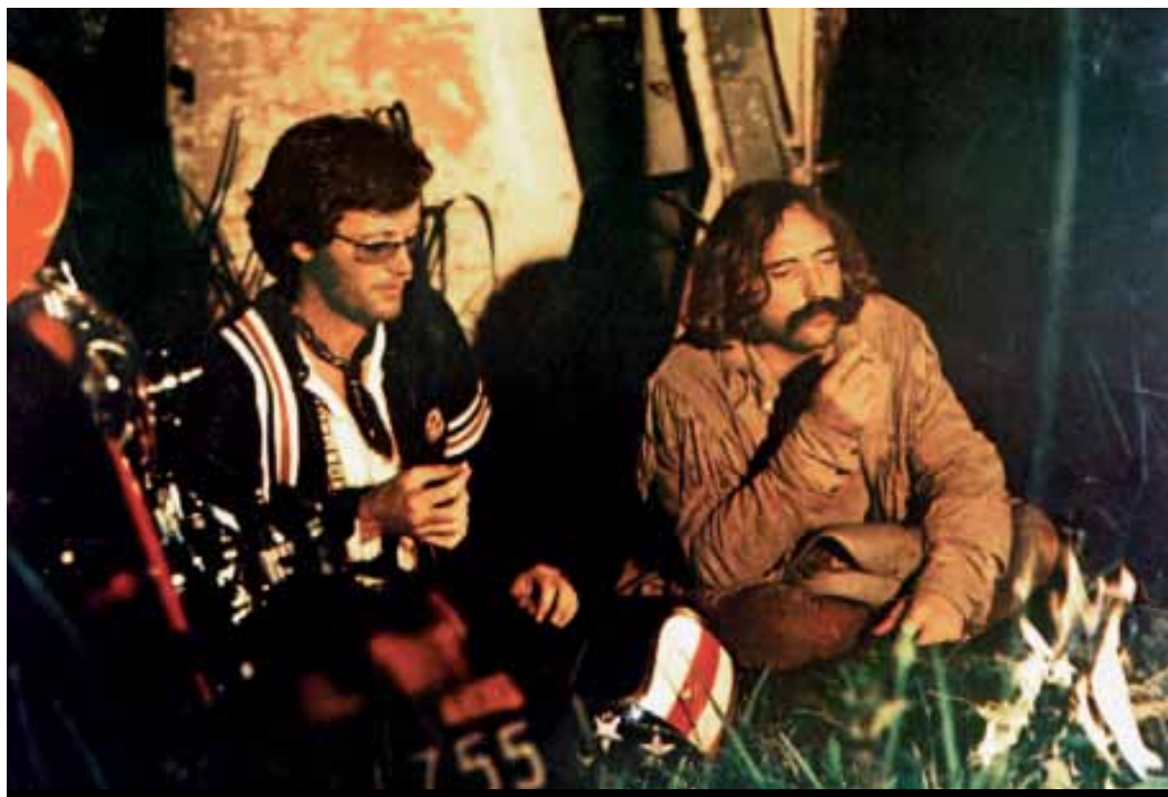
Peter Fonda et Dennis Hopper dans Easy Rider (1969)