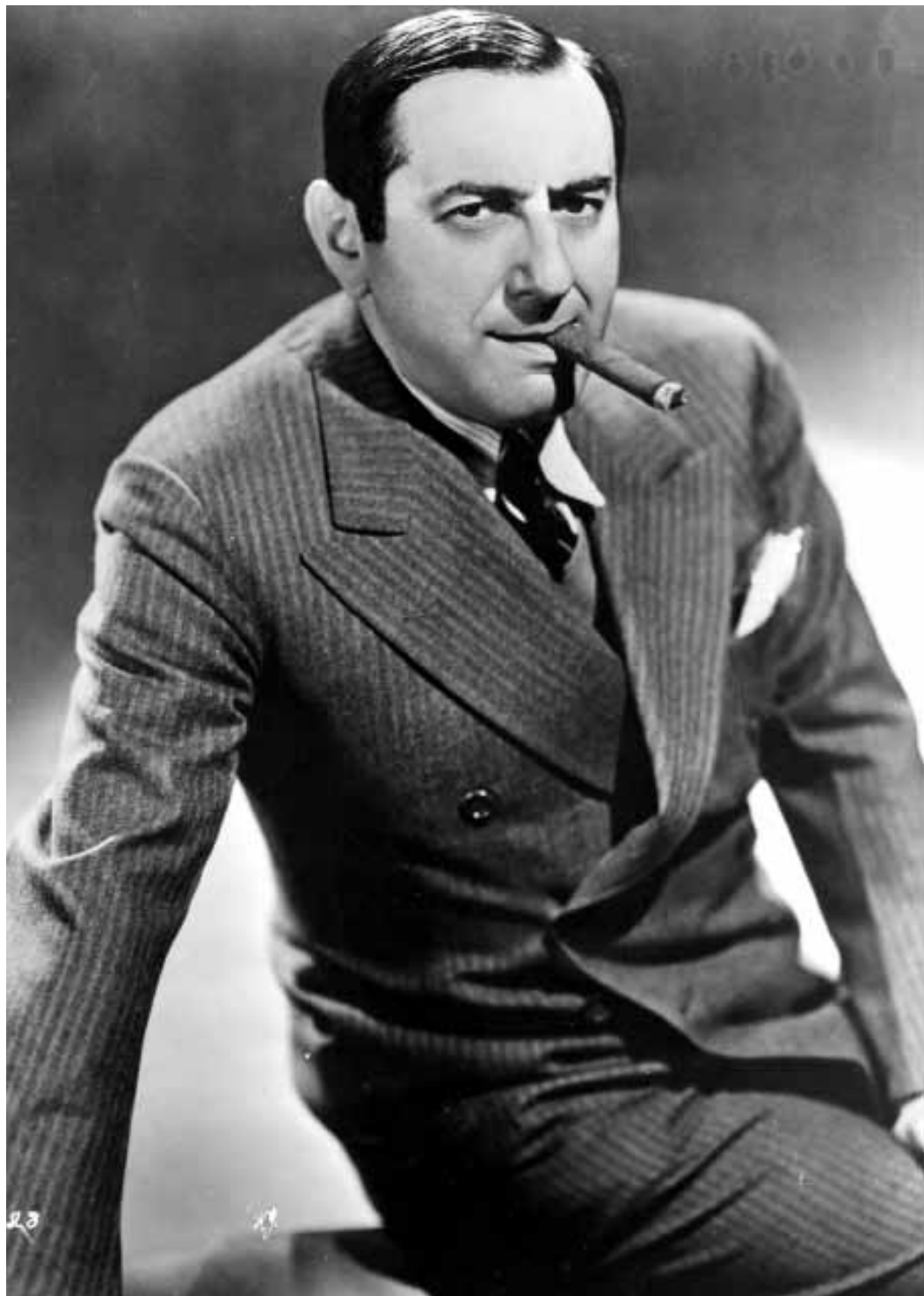
Ernst Lubitsch (1892-1947)