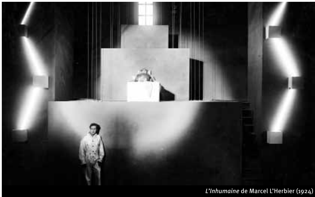
L'Inhumaine de Marcel L'Herbier (1924)